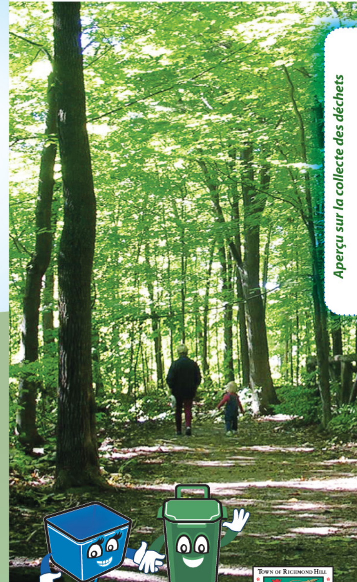
Aperçu sur la collecte des déchets